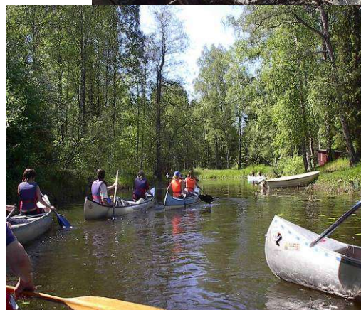
Paddla kanot i Bergslagskanalens sjösystem