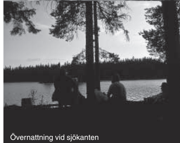
Övernattning vid sjökanten