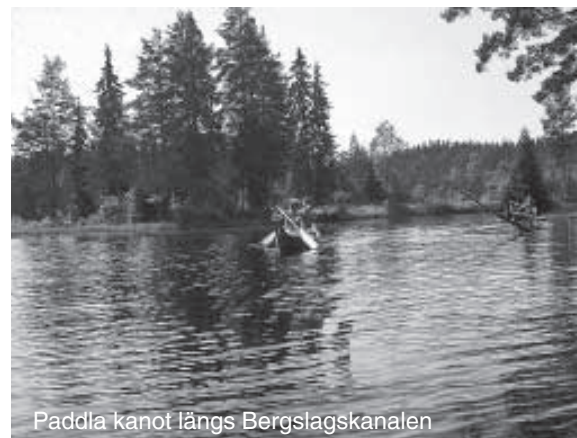
Paddla kanot längs Bergslagskanalen

Efter att ha passerat Ullvettern, Frövettern och Käxsundet kommer vi ut i sjön Alkvettern som fungerar som en vändpunkt på färden. Nu vänder vi åter norrut och tar sikte på Storfors som blir vår slutdestination på denna resa.