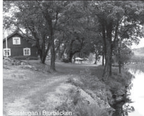
Slusstugan i Bjurbäcken